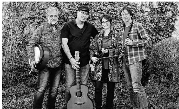
Temperamentvoller Irish-Celtic Folk mit „Colludie Stone“

Zwei bisher erschienene CDs – „Native Land“ (2015) und „Streetwise“ (2019) erhielten beste Pressekritiken. Tickets gibt es über reservix oder neben der Postfiliale bei Yvonne Sautter (Mo–Sa, 9.00 bis 12.30 Uhr): Vorverkauf 20,00 Euro / Abendkasse 22,00 Euro. Jugendliche erhalten 5,00 Euro Ermäßigung.