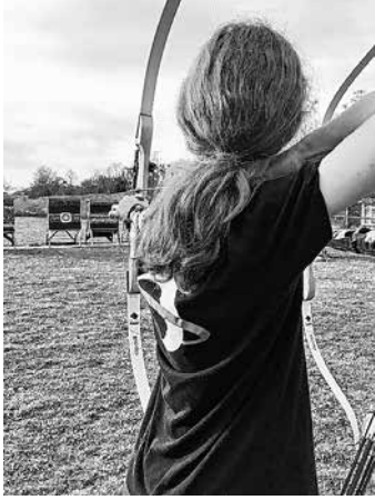
Jugendliche an der Schießlinie

Bei Interesse Anfragen gern per Email an: Jugendleitung_Bogen@schuetzenverein-bondorf.de